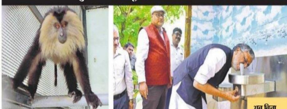
शेर की तरह पूंछ वाला मकाक बंदर ( लाइन टेल मकाक) . जू में आधुनिक नलों का उद्घाटन करने के बाद पानी पीते डिप्टी सीएम सुशील कुमार मोदी .